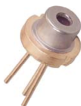
شکل ۲- دیود ساخت شرکت سامسونگ

در تصویر شماتیک بالا، واحد منبع تغذیه (power supply) در مدار وظیفه تأمین انرژی مورد نیاز قسمت های مختلف را بر عهده دارد این واحد که با واحدهای PWM، درایو و Feedback در ارتباط است، توانی در حدود نیم وات را باید تأمین کند که به راحتی توسط یک یا دو عدد باتری قلمی تأمین می گردد. واحد PWM یکی از واحدهای مهم مدار است که وظیفه تولید پالس با فرکانس های مختلف را برای پمپاژ لیزر بر عهده دارد. این مدار قابلیت تولید پالس هایی با