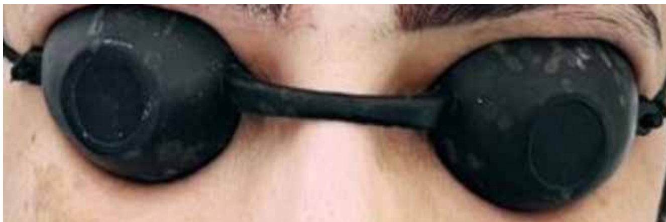
شکل ۱۰- عینک بیمار که با باریکه لیزر مواجهه داشته است.

هدف از استانداردسازی توسط سازمان بین‌المللی استاندارد در جهت ارتقاء بخشیدن به کیفیت، ایمنی، کارایی، قابلیت اطمینان، تعویض‌پذیری و سازگاری است. از جمله مزایایی که استانداردسازی برای مصرف‌کنندگان دارد، می‌توان به موارد زیر اشاره کرد: استفاده از محصولات با کیفیت و قیمت بهتر، استفاده از خدمات پس از فروش، کاهش ریسک عدم شناخت محصولات، منافع استانداردسازی برای جامعه شامل حفظ سلامت و بهداشت، استفاده بهینه، افزایش کارایی و رعایت موازین زیست‌محیطی است. لذا توجه به استانداردهای تجهیزات لیزر پزشکی می‌تواند ضمن حفظ سلامت و بهداشت خانواده از بروز خطا و آسیب‌های ناشی از خرابی‌های دستگاه جلوگیری کند. و در این راه آشنایی کاربران لیزر پزشکی از اهمیت خاصی برخوردار است.