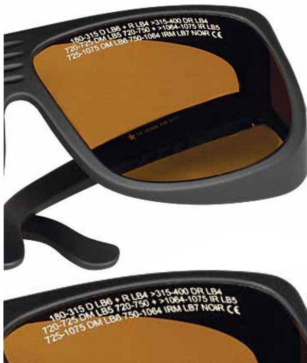
شکل ۸- عینک محافظ لیزر بر مبنای معیار LB

هرچه بیشتر باشد بهتر است. میدان دید شخص هنگام استفاده از عینک کافی باشد. اثرات شیمیایی ایجاد شده بر ماده جاذب عینک سبب ایجاد اشکال دائمی در عینک نشود. فیلتر عینک معمولاً از شیشه، پلی‌کربنات یا شیشه روکش‌دار ساخته می‌شود. در زمان کار با مواد شیمیایی، به‌خصوص در زمان تمیز کردن عینک ماده مورد استفاده نباید اثرات منفی روی فیلتر بگذارد. در استانداردهای موجود آمده است که از آب‌صابون برای شستن عینک استفاده شود. استفاده از عینک راحت باشد و به‌خوبی روی صورت تنظیم شود به‌گونه‌ای که مانع رسیدن نور از هر طرف به چشم شود. با