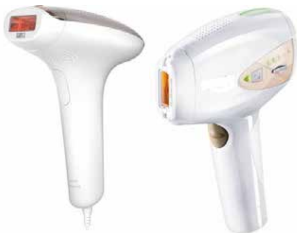
شکل ۳- نمونه‌هایی از لیزر خانگی

آنها به تماس با پوست متکی است و ولتاژ نامی آنها بیش از ۷۲۵۰ نیست. این استاندارد لوازمی با سطح تابش نور کمتر از ۲۵ سانتی‌متر مربع را پوشش می‌دهد. وسایلی که برای مصارف معمولی خانگی در نظر گرفته نشده‌اند، اما ممکن است منبع خطری برای عموم باشند مانند وسایلی که برای استفاده در سالن‌های زیبایی و اماکن مشابه در نظر گرفته شده‌اند نیز در محدوده این استاندارد هستند.