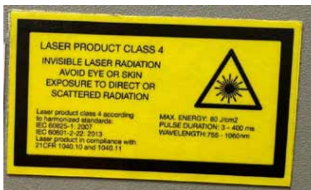
شکل ۱ - نمونه برچسب اطلاعات دستگاه و نشان‌دهنده استانداردهای آن

محصولات لیزری گسیل‌کننده تابش لیزر در گستره طول موج ۱۸۰ nm تا ۱ mm هستند اگر چه لیزرهایی وجود دارند که طول موج‌های کوچکتر از ۱۸۰ nm (فرابنفش خلاً) گسیل می‌کنند اما اغلب تجهیزات پزشکی پرکاربرد در ناحیه پرتوهای نوری (فرابنفش - مرئی - فروسرخ) قرار دارند. طول موج‌های کمتر در هوا جذب می‌شوند و بایستی در محیط بسته استفاده شوند. یک محصول لیزری ممکن است شامل یک تک لیزر همراه با یا بدون یک منبع تغذیه مجزا باشد یا ممکن است دربرگیرنده یک یا چند لیزر در یک سامانه پیچیده اپتیکی، الکتریکی یا مکانیکی