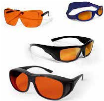
شکل ۶- نمونه عینک کاربر

توجه به آنکه در زمان کار با لیزر باید از عینک محافظ استفاده شود، عینک نباید باعث ایجاد خستگی و آزرده‌گی شود. اگر شخص کاربر از عینک طبی استفاده می‌کند، عینک لیزر باید به نحوی انتخاب شود که بر روی عینک طبی استفاده گردد. عینک باید مقاومت کافی در برابر باریکه‌های لیزری و عوامل مکانیکی داشته باشد. عینک محافظ باید دارای برجسب مشخصات باشد و طول موجی که عینک در آن تضعیف دارد و میزان تضعیف بر روی فیلتر آن حک شده باشد (شکل ۱۰-۷). برای آزمون عینک فقط از طریق طیف‌نگاری می‌توان به درستی میزان تضعیف آن پی برد. از آنجا که