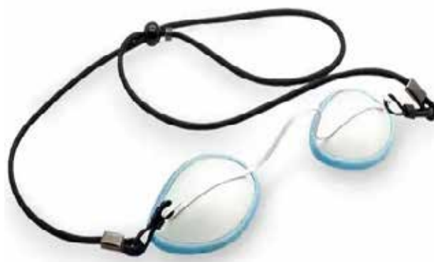
شکل ۹- نمونه‌هایی از عینک بیمار

عینک برای حفاظت در برابر بازتاب‌های پراکنده می‌باشد قراردادن آن در برابر باریکه مستقیم لیزر برای آزمون باعث خرابی آن خواهد شد.