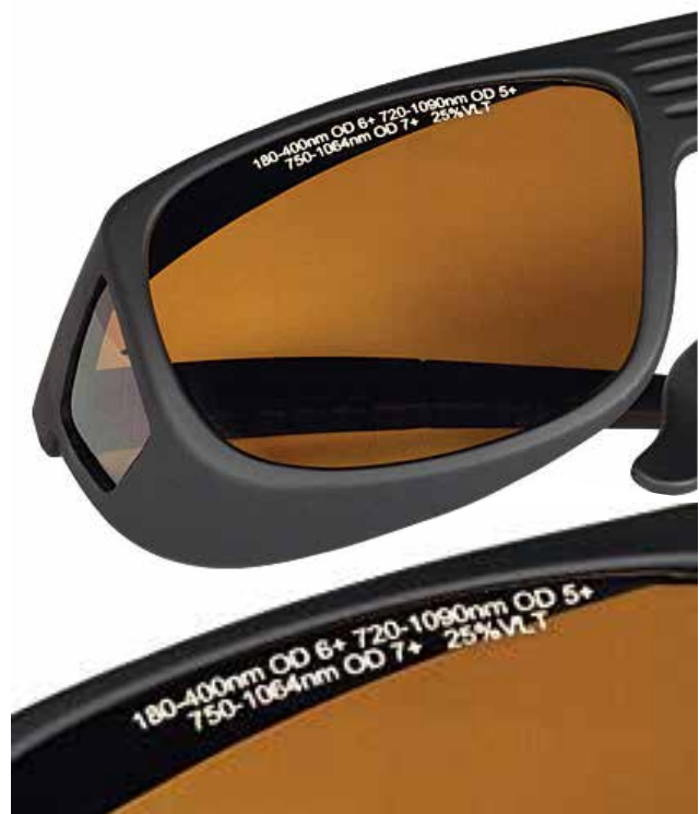
شکل ۷- عینک محافظ لیزر بر مبنای معیار OD