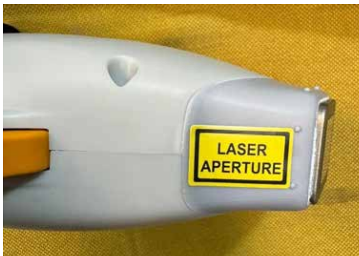
شکل ۵- برجسب محل خروج نور لیزر