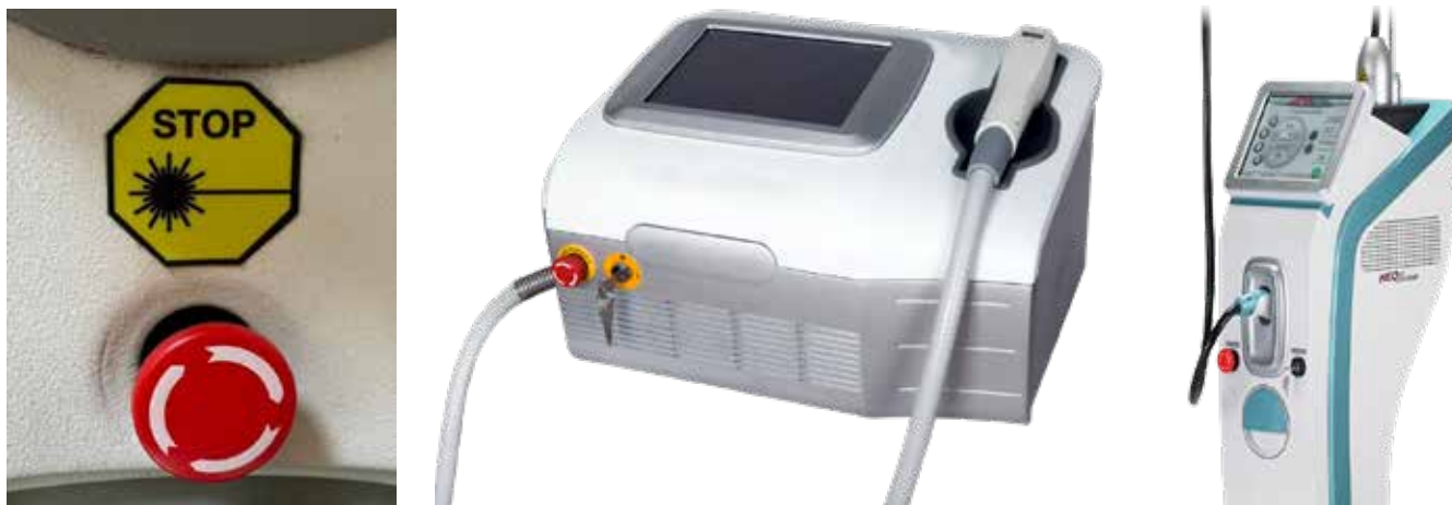
شکل ۴- کلید قطع اضطراری

تضعیف داشته باشد. میزان تضعیف بر مبنای دو معیار OD و LB نمایش داده می‌شود (شکل ۷ و ۸). میزان تضعیف عینک به‌گونه‌ای باشد که شدت نور پشت عینک و در محل چشم کمتر از حدود تعیین شده باشد. مقدار شدت نور لیزر در پشت عینک نباید از مقدار MPE لیزر فراتر رود. عینک فقط برای حفاظت در برابر شدت نور لیزر پراکنده است و در برابر بازتاب‌های آینه‌ای و یا مستقیم حفاظت ندارد از این‌رو در کاربردهای پزشکی عینک کاربر و بیمار فرق دارند و برای بیمار نمی‌توان از همان عینک کاربر استفاده شود. عینک بیمار معمولاً از جنس استیل یا تیتانیوم است که در صورت برخورد مستقیم حفاظت کافی داشته باشد (شکل ۹). تاثیر عینک بر دیدن رنگ‌ها سبب ایجاد اشکال در فعالیت نشود. این عامل توسط ضریب «درصد عبور نور مرئی یا VLT» مشخص می‌شود که