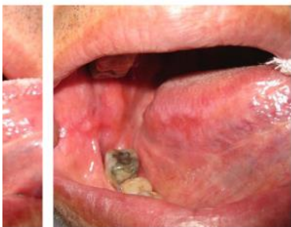
شکل ۱: تاثیر LLLT بر روی ضایعه‌ای در مرز جانبی زبان در یک مرد ۵۲ ساله با ضایعه فرسایشی OLP (پیکان سیاه موجود در شکل)، که در آن عکس سمت چپ قبل از درمان و عکس سمت راست سه ماه بعد از درمان می‌باشد [۱۱].

عمل خونریزی کاهش می‌یابد. این درمان با لیزر کم انرژی LLLT صورت گرفته که با تغییرات غیر مخربی که انجام می‌دهد، به‌عنوان لیزر تحریک زیستی هم شناخته شده است و اساس استفاده از لیزر می‌باشد. از مزایای استفاده از آن اثرات ضدالتهابی، تسریع در بهبود زخم و اثرات ضد درد آن می‌باشد. در شکل (۱) نمونه‌ای از جراحی این بیماری با این لیزر نشان داده شده است [۱۱].