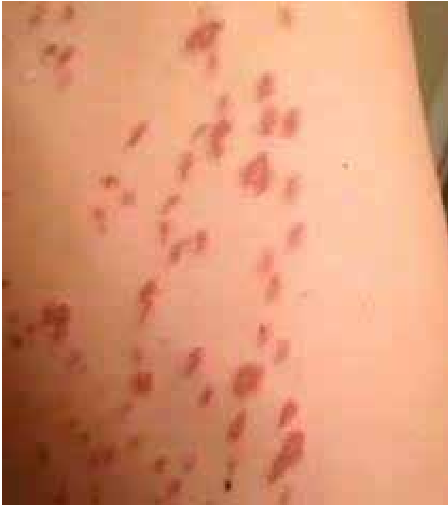
شکل ۲: آسیب سوختگی پوست به دنبال لیزر موهای زائد

ناحیه ورید یا شریان باشد، می‌تواند با خونریزی شدید نیز همراه باشد. تابش لیزر به پوست بسته به طول موج و توان، صدمات متفاوتی را در پی دارد. از جمله این صدمات می‌توان به سوختگی پوستی (burn)، ایجاد اسکار (scar) تغییرات کروموفورهای پوستی (pigmentary change)، اریتما (erythema)، ادم (edema)، و درد اشاره نمود.