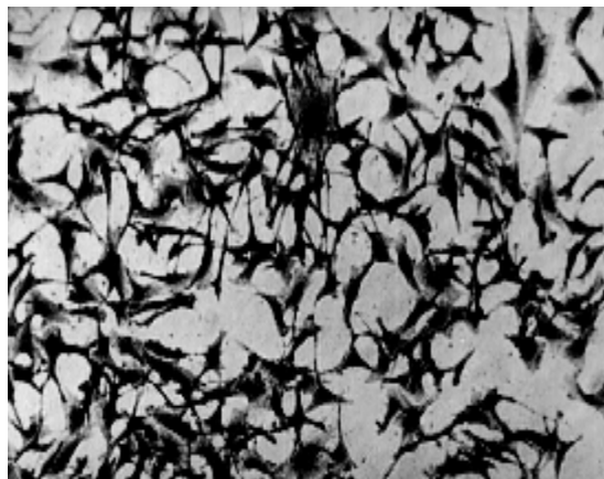
شکل ۲- شکل ظاهری سلول های U87 MG در کشت تک لایه با بزرگ نمایی 10\times

۱- vehicle، ۲- تیمار شده با 2ME2 طی یک VDT، ۳- تیمار شده با MX طی یک VDT، ۴- تیمار شده با IUdR طی یک VDT و سپس تابش پرتو گامای کبالت 60\text{Co} ، ۵- تیمار شده با 2ME2، IUdR طی یک VDT و سپس تابش پرتو گامای کبالت 60\text{Co} ، ۶- تیمار شده با MX، IUdR طی یک VDT و سپس تابش پرتو گامای کبالت 60\text{Co} ، ۷- تیمار شده با 2ME2، MX، IUdR طی یک VDT و سپس تابش پرتو گامای کبالت 60\text{Co} ، درصد سلول های زنده و میزان آسیب های سیتوتوکسیک