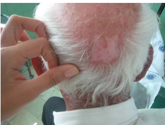
شکل ۴- بیمار b با BCC ناحیه اسکالپ بعد از PDT با پاسخ کامل