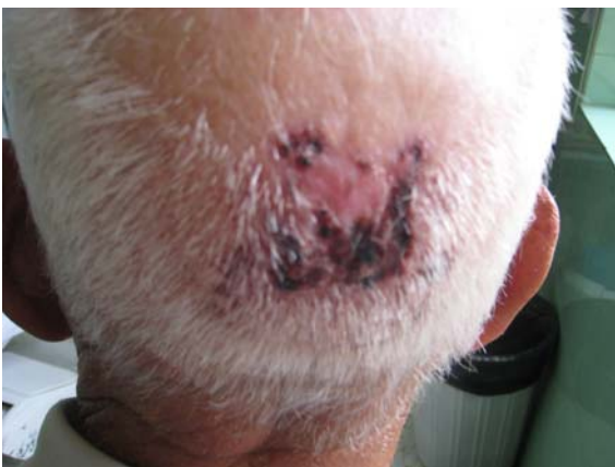
شکل ۳- بیمار b با BCC ناحیه اسکالپ قبل از PDT