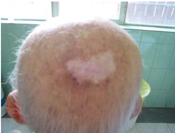
شکل ۲- بیمار a با BCC ناحیه اسکالپ بعد از PDT با پاسخ نسبی

از ۲۸ ضایعه مورد مطالعه ۲۳ ضایعه 82/1 ٪ به درمان پاسخ دادند و ۵ ضایعه 17/9 ٪ هیچ پاسخی ندادند. از مواردی که به درمان پاسخ دادند ۱۴ مورد پاسخ نسبی (شکل های شماره ۱ و ۲) و ۹ مورد پاسخ کامل داشتند. (شکل های شماره ۳ و ۴).