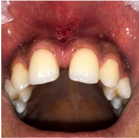
(شکل ۱۴-۳) بیمار گروه دوم یک هفته پس از درمان در روش کانونشنال