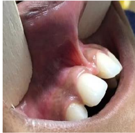
(شکل ۹-۳) بیمار گروه دوم قبل از جراحی کانونشنال از نمای طرفی