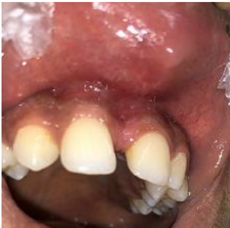
(شکل ۱۵-۳) بیمار گروه دوم یکماه پس از درمان در روش کانونشنال