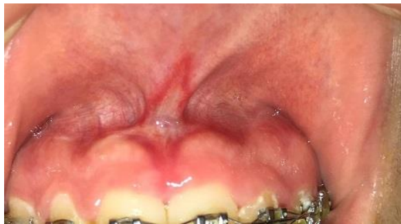
(شکل ۱۲-۳) بیمار گروه اول یک هفته پس از جراحی با لیزر