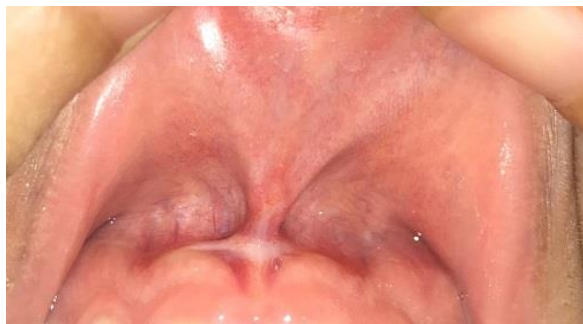
(شکل ۱۳-۳) بیمار گروه اول یکماه پس از جراحی با لیزر