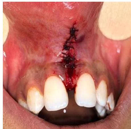
(شکل ۱۱-۳) بیمار گروه دوم پس از جراحی کانونشنال

در این مطالعه ۲۳ بیمار مورد مطالعه قرار گرفتند. که ۳ بیمار به علت حضور پیدا نکردن در جلسات پیگیری از مطالعه حذف شدند و در نهایت ۲۰ بیمار وارد مطالعه شدند. میانگین \pm انحراف معیار سن گروه لیزر 28/4 \pm 6/4 سال و گروه کانونشنال 25/3 \pm 6/0 سال بوده است. توزیع سنی دو گروه تفاوت معنی دار نداشت ( p=0/247 ). کم‌ترین و بالاترین سن در بیماران گروه لیزر به ترتیب ۱۸ و ۳۶ سال و گروه کانونشنال به ترتیب ۱۷ و ۳۲ سال بوده است. از نظر جنسیت ۷۰ درصد گروه لیزر و ۶۰ درصد گروه کانونشنال زن بودند. توزیع جنسی دو گروه تفاوت معنی دار نداشت ( p=1/00 ) (جدول ۱). تحصیلات ۴۰ درصد بیماران گروه لیزر و ۵۰ درصد گروه کانونشنال دانشگاهی بود. توزیع سطح تحصیلات دو گروه تفاوت معنی داری نداشت ( p=0/631 ).