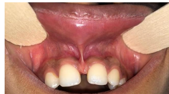
(شکل ۸-۳) بیمار گروه دوم قبل از جراحی کانونشنال از نمای روبرو