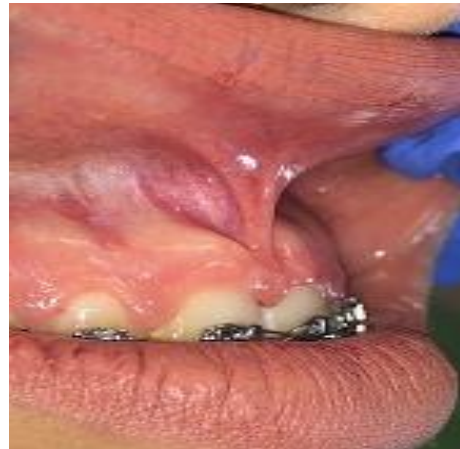
(شکل ۵-۳) بیمار گروه اول قبل از جراحی با لیزر از نمای طرفی