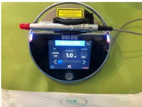
شکل ۲-۳) دستگاه لیزر دایود

از بیماران خواسته شد تا به طور جداگانه میزان درد و ناراحتی مربوط به خوردن و جویدن (میزان رضایت مندی) را در یک مقیاس آنالوگ بصری ۱۰ سانتیمتری (VAS)، بلافاصله بعد از عمل جراحی، روز سوم و روز هفتم را به طور جداگانه ارزیابی کنند. نقطه پایانی سمت چپ به عنوان "بدون درد" و نقطه پایانی سمت راست به عنوان "بدترین درد قابل تصور" نام گذاری شده است [۱۴]. اطلاعات دموگرافیک، رضایت مندی بیماران وارد فرم داده‌ها گردید. با استفاده از آزمون‌های دقیق فیشر، شاپیرو ویلک، تی استیودنت و من‌ویتنی و با استفاده از نرم‌افزار SPSS 24.0 در سطح معنی‌داری ۰/۰۵ تحلیل داده‌ها انجام شد.