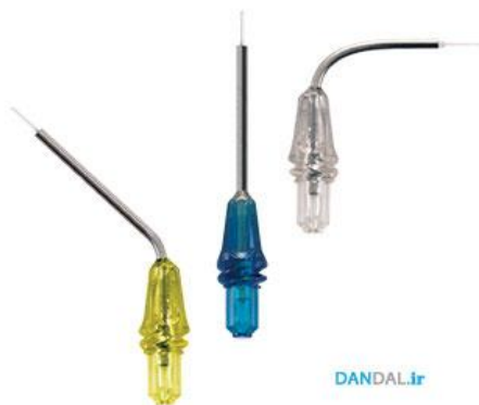
شکل ۳-۳) تیپ‌های دستگاه لیزر دایود