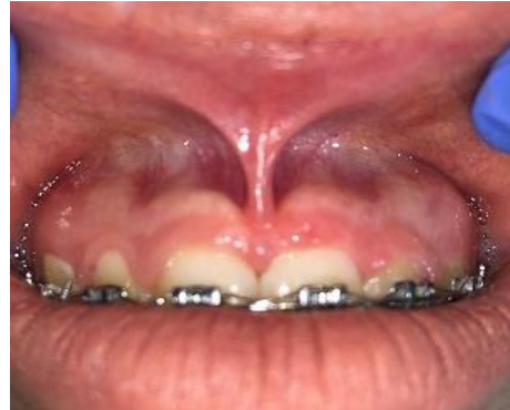
(شکل ۴-۳) بیمار گروه اول قبل از جراحی با لیزر از نمای روبرو