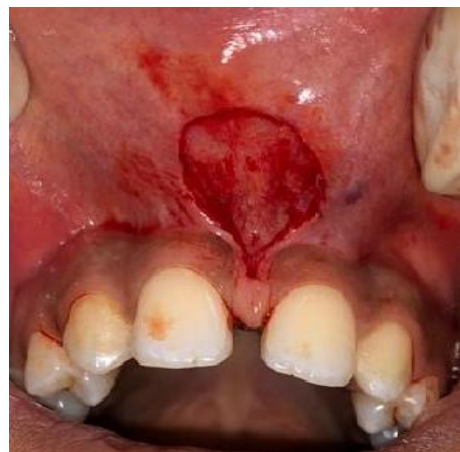
(شکل ۱۰-۳) بیمار گروه دوم حین جراحی کانونشنال