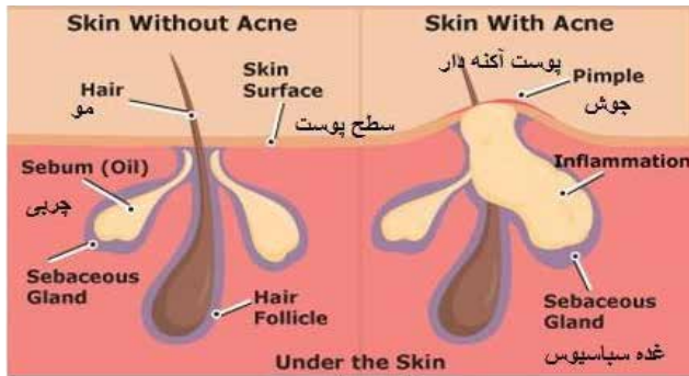
شکل ۱: آکنه در پوست

هر چه جوش صورت فرد شدیدتر باشد احتمال ایجاد جوشگاه بیشتر است. جوش‌هایی که به صورت برجسته و کیستی هستند تقریباً در ۱۰۰ درصد موارد اسکار به جا می‌گذارند. بعضی افراد از نظر خانوادگی مستعد اسکار هستند بدین معنی که در سایر افراد خانواده هم پس از ایجاد زخم یا ضایعه پوستی، جای آن باقی می‌ماند. این بیماران بیشتر در خطر ایجاد اسکار در اثر جوش‌های صورت هستند. هر چه فرد مبتلا به جوش صورت درمان بیماری خود را دیرتر شروع کند، احتمال ابتلا به اسکار آکنه در او بیشتر است. در صورتی که فرد بیش از ۳ سال اقدام به درمان آکنه نکند، این احتمال به شدت افزایش می‌یابد. این مسئله لزوم درمان سریع جوش صورت را گوشزد می‌کند. اصولاً اسکارهای آکنه به دودسته فرورفته و برجسته تقسیم می‌شوند. برای درمان اسکارهای ناشی از جوش صورت از روش‌های مختلفی استفاده می‌شود [۱۴-۱۱].